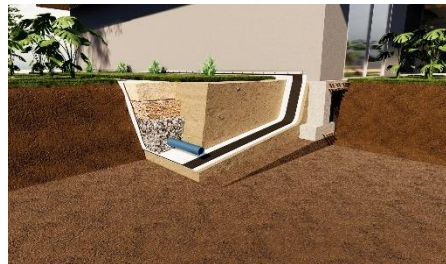
Pièce sur-mesure pour prévenir le Retrait Gonflement des Argiles : Ceinture étanche