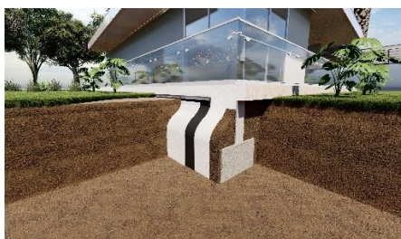
Pièce sur-mesure pour prévenir le Retrait Gonflement des Argiles : Ancrage homogène amont/aval