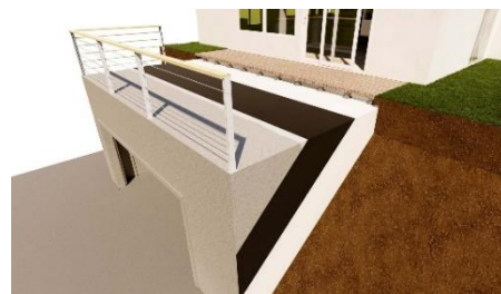
Pièce 3D sur-mesure : Local semi-enterré