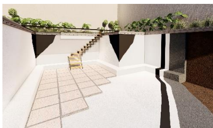
Pièce 3D sur-mesure : Cuvelage ou assimilé (Cave à vin par exemple)