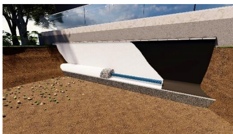
Pièce 2D sur-mesure : Protection de soubassement